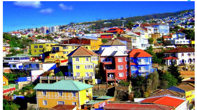
Valparaíso - Viña del Mar